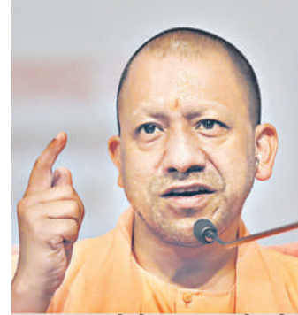
गुंडा थाने के एसएचओ को निर्बंधित करने के आदेश

लखनऊ / यूटर्न: दिल्ली में हनुमान जयंती पर निकली शोभायात्रा के दौरान हुए उपद्रव के बाद योगी सरकार अलर्ट मोड में है। उत्तर प्रदेश में कानून व्यवस्था को दुरुस्त बनाए रखने के लिए योगी सरकार ने अफसरों के लिए नए दिशा निर्देश जारी किए हैं। इसके मुताबिक 4 मई तक सारे अफसरों की छुट्टियां रद्द कर दी गई हैं। जो अवकाश पर हैं उन्हें 24 घंटे के अंदर ऑफिस जॉइन करने को कहा गया है। सोमवार को हुई वीडियो कॉन्फ्रेंसिंग में सभी मंडलों के मंडलायुक्त, पुलिस आयुक्त, ADG जोन, IG और DIG शामिल थे। मुख्यमंत्री ने कहा कि आने वाले दिनों में कई महत्वपूर्ण धार्मिक पर्व-त्योहार हैं। रमजान का महीना चल रहा है। ईद का त्योहार और अक्षय तृतीया एक ही दिन होना संभावित है। ऐसे में वर्तमान परिवेश को देखते हुए पुलिस को अतिरिक्त संवेदनशील रहना होगा। सीएम का आदेश है कि थानाध्यक्ष से लेकर एडीजी तक अगले 24 घंटे के भीतर अपने-अपने क्षेत्र के धर्मगुरुओं और समाज के अन्य सम्मानित लोगों के साथ संवाद बनाएं। संवेदनशील क्षेत्रों में अतिरिक्त पुलिस बल की तैनाती की जाए। ड्रॉन का उपयोग कर स्थिति पर नजर रखें। हर दिन